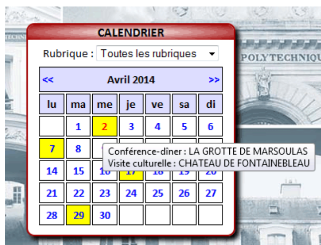
Calendrier des manifestations